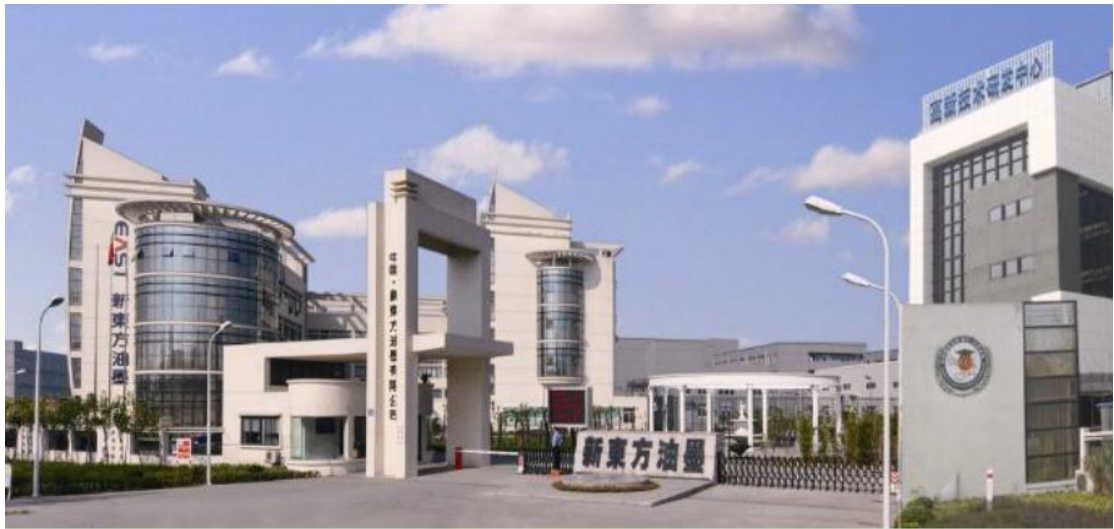
图 B. 1-1 公司现代化高新园区

公司从 2016 年 5 月开始导入卓越绩效管理，建立自我评价机制，定期组织管理层开展管理成熟度评审，到优秀企业参观学习，按“领导班子统一认识；中层领导倾力推进；广大员工积极参与；各个部门全力以赴”的原则，把卓越绩效管理向全公司推广，促进企业管理再上新台阶。